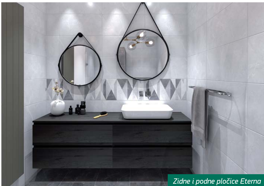
Zidne i podne pločice Eterna