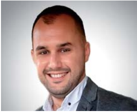
Pripremio: Marin Bošnjaković, Služba riznice Nexe grupa d.d.

U ovom broju donosimo novu temu u seriji članaka o osiguranju. Vjerujemo da će biti korisno doznati više o automobilskim osiguranjima na primjeru hrvatskog zakonodavstva.