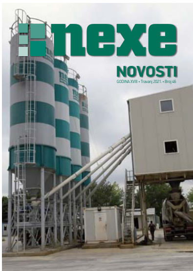
Fotografija s naslovnice: Nexe beton d.o.o. Novi Sad