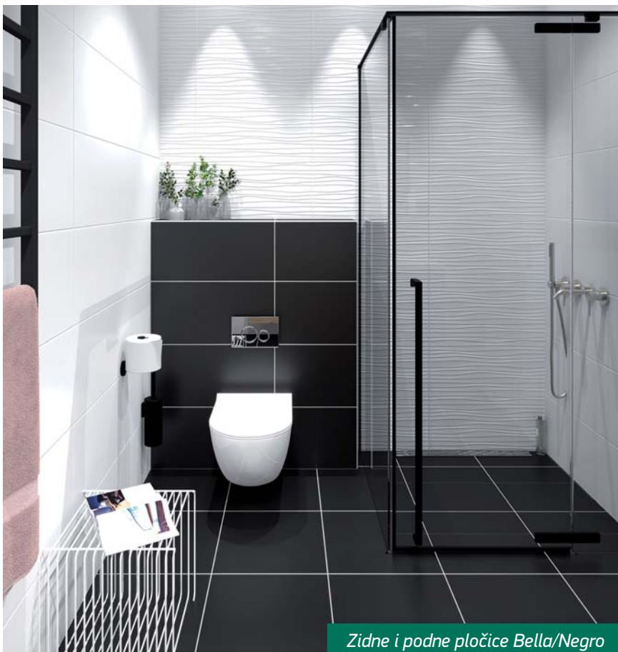
Zidne i podne pločice Bella/Negro

Dizajnerski osvježena izdanja već dobro poznatih i kod kupaca traženih dimenzija 25x40, 25x50, 20x50, 33x33, 40x40, od kraja prošle godine Polet - keramika dopunila je sve traženijim dimenzijama zidnih pločica 30x60 cm. Upravo ova dimenzija zidnih pločica predstavlja najbolji odnos cijene i kvalitete na domaćem tržištu. A kvalitetu domaćeg proizvoda kojeg su stvarali domaći ljudi iz domaće sirovine Polet - keramika svojim kupcima potvrđuje i znakom Čuvarkuća dodijeljenim od strane Privredne komore Srbije.