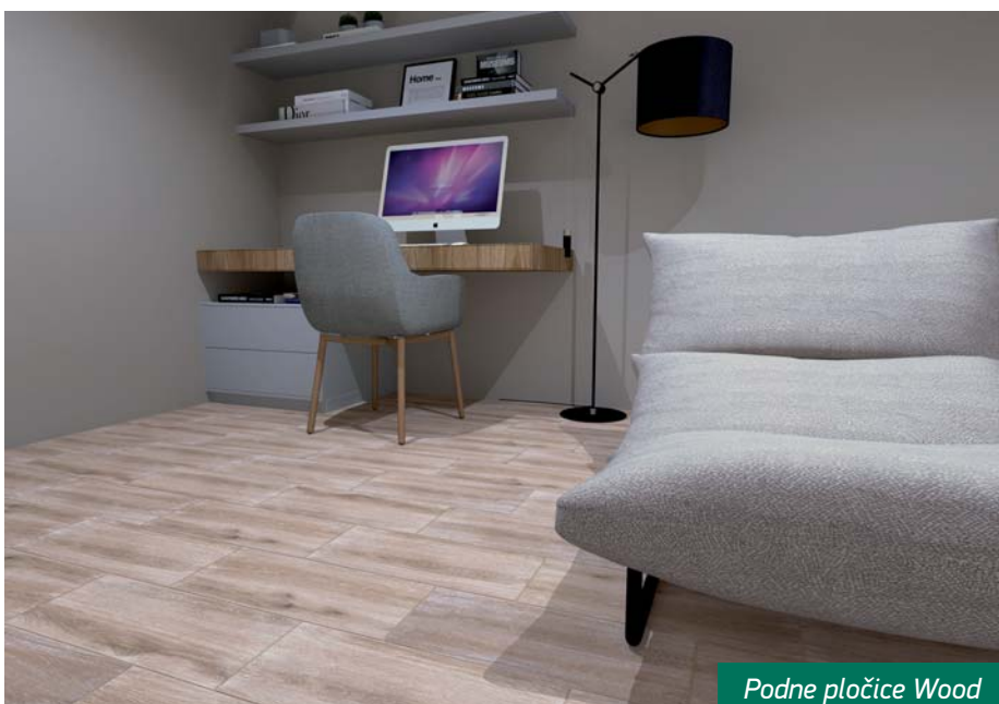
Podne pločice Wood