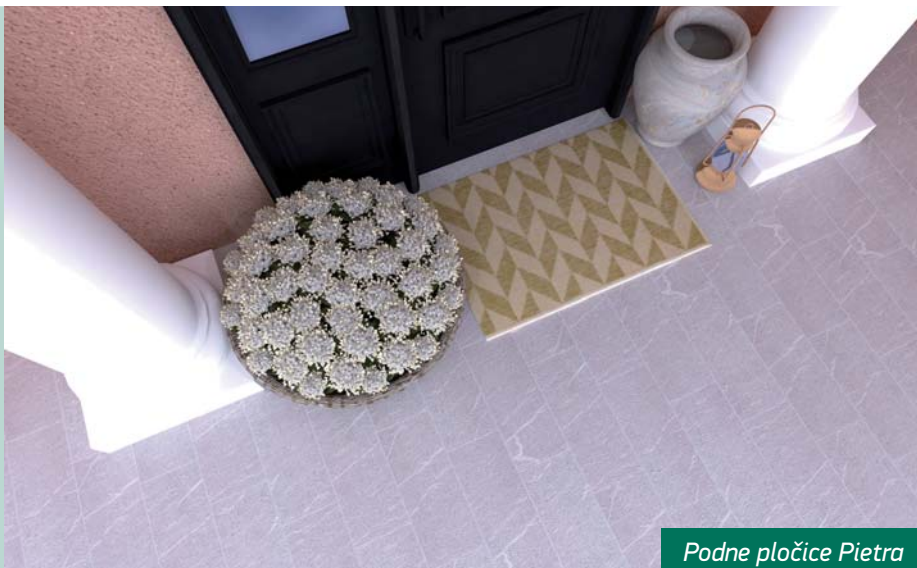
Podne pločice Pietra

Kamen je još uvijek vrlo tražen uzorak kod kupaca keramičkih pločica. Površina pločica koja svojim reljefom i printom odražava uzorak kamena lako se uklapa u brojne ambijente inspirirane prirodom. Neutralnost kamenih materijala omogućava stvaranje mirnog i opuštajućeg ambijenta u domu. ■