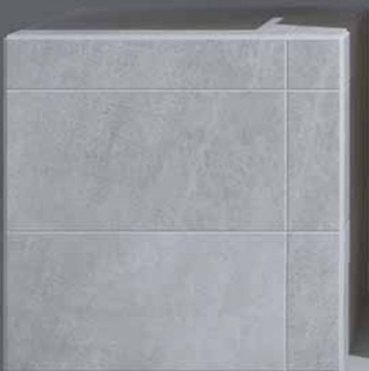
Active ( 25 x 50 cm )