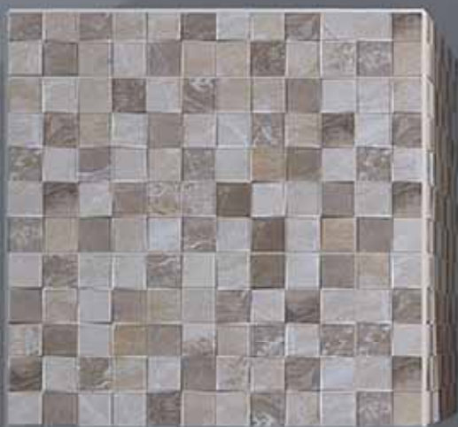
Real ( 25 x 50 cm )