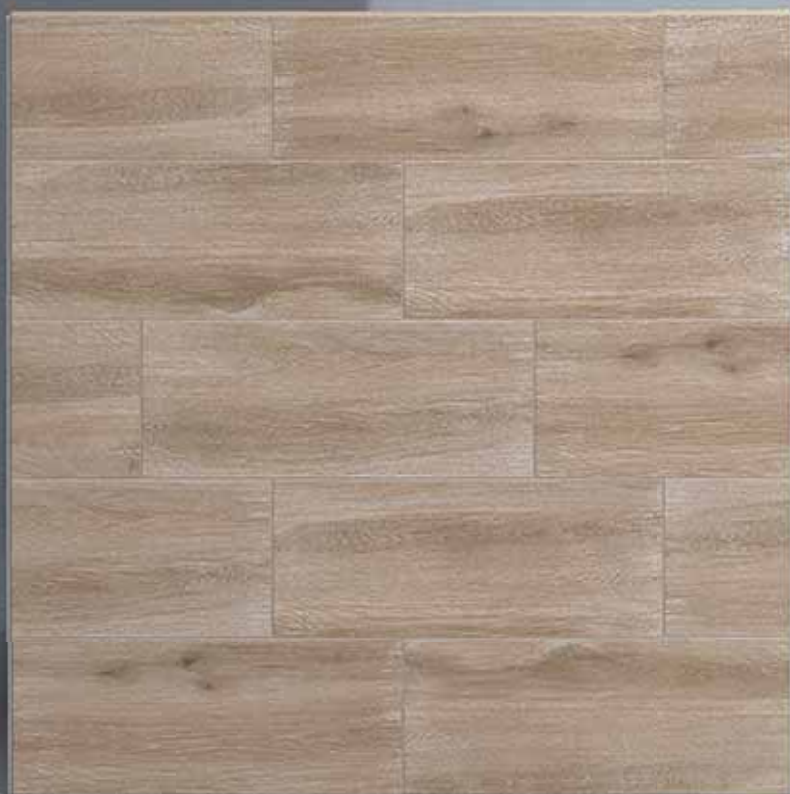
Wood ( 20 x 50 cm )