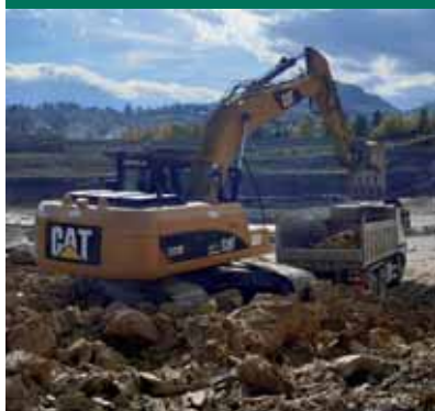
Fotografija s naslovnice: Tvornica opeke d.o.o. Sarajevo