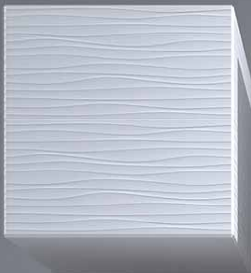
Bella ( 30 x 60 cm )