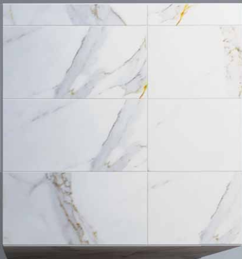
Calacatta ( 30 x 60 cm )