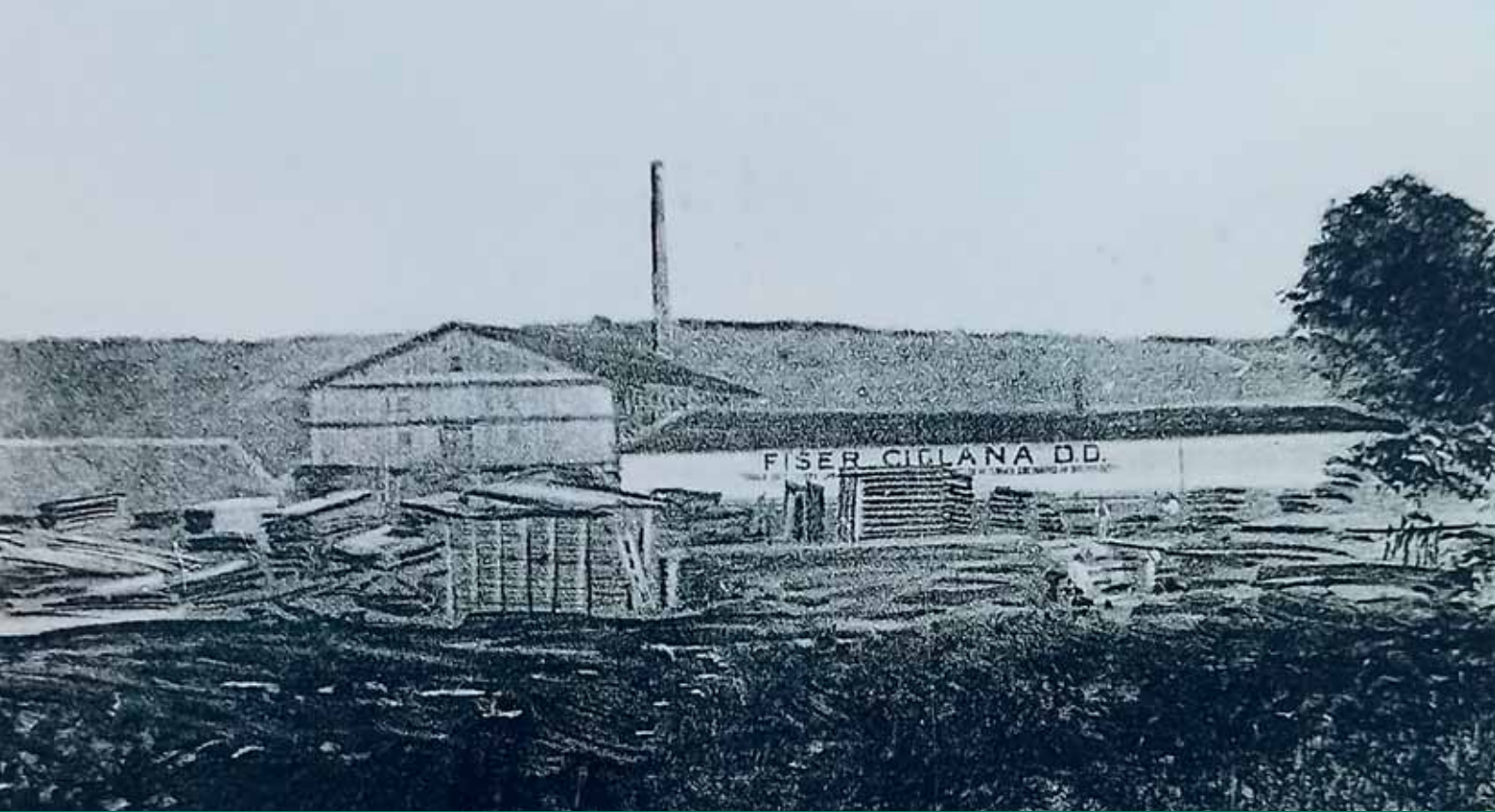
Ciglana Maxa Fischera kraj Našica